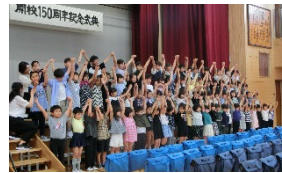
全校児童によるメッセージ

記念演奏 「スペインの風」の お二人の演奏。大人も 子供も大盛り上がり！ すてきな演奏でした。